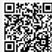
วิดีโอการใช้งานระบบ Inventech

*หมายเหตุ การทำงานของระบบประชุมผ่านสื่ออิเล็กทรอนิกส์ และระบบ Inventech Connect ขึ้นอยู่กับระบบอินเทอร์เน็ตที่รองรับของผู้ถือหุ้นหรือผู้รับมอบฉันทะ รวมถึงอุปกรณ์ และ/หรือ โปรแกรมของอุปกรณ์ กรุณาใช้อุปกรณ์ และ/หรือโปรแกรมดังต่อไปนี้ในการใช้งานระบบ