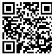
คู่มือการใช้งาน e-Voting